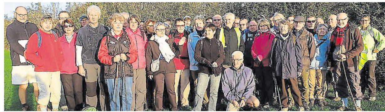
Une cinquantaine de membres ont participé à la randonnée avant l'assemblée générale.

L'Association départementale de tourisme pédestre du Calvados (Adtpc) a organisé, dimanche, une randonnée dont le départ a été fixé devant l'espace Letellier.