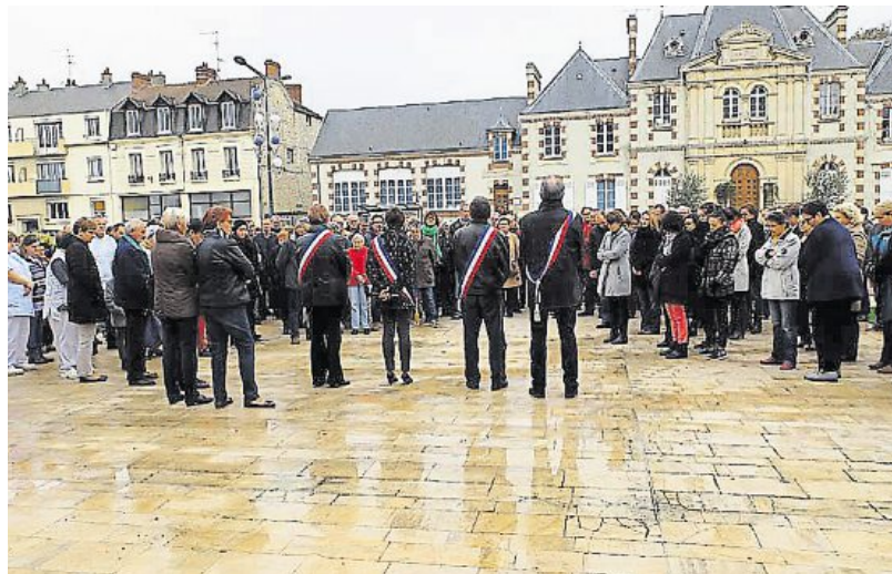
Les Mondevillais et le personnel municipal se sont recueillis sur le parvis de l'hôtel de ville.

Permanence le mercredi 18 novembre, de 15 h à 17 h, mairie, 6, rue Chapron.