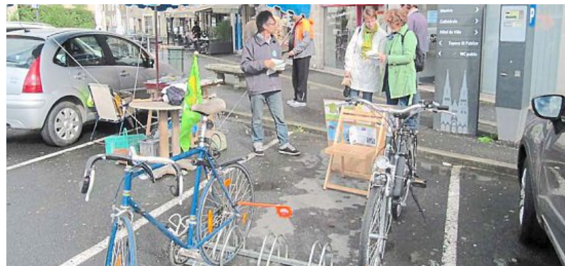
Ils ont voulu sensibiliser les passants sur la place du vélo dans la ville.