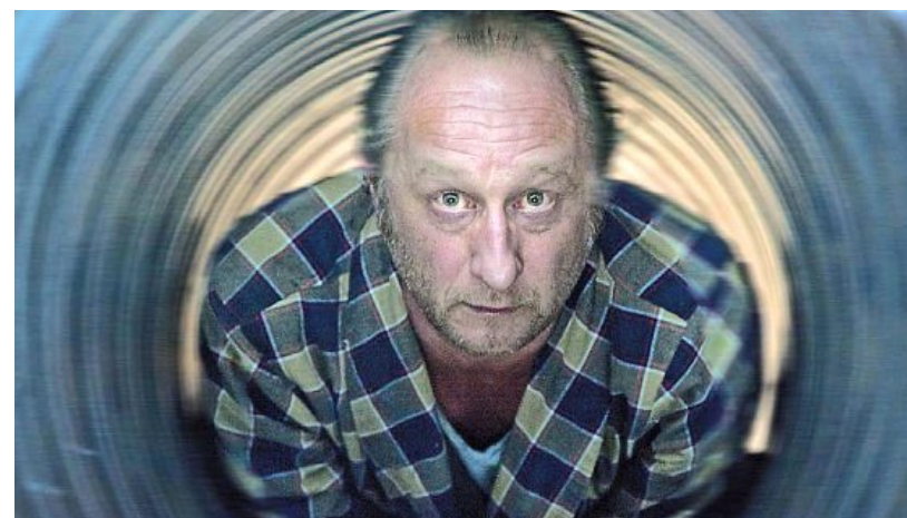
« Le tout nouveau testament » avec Benoît Poelvoorde réalise la meilleure performance de la semaine.

La semaine dernière, le Méliès a vu passer 272 spectateurs, de mercredi à lundi.