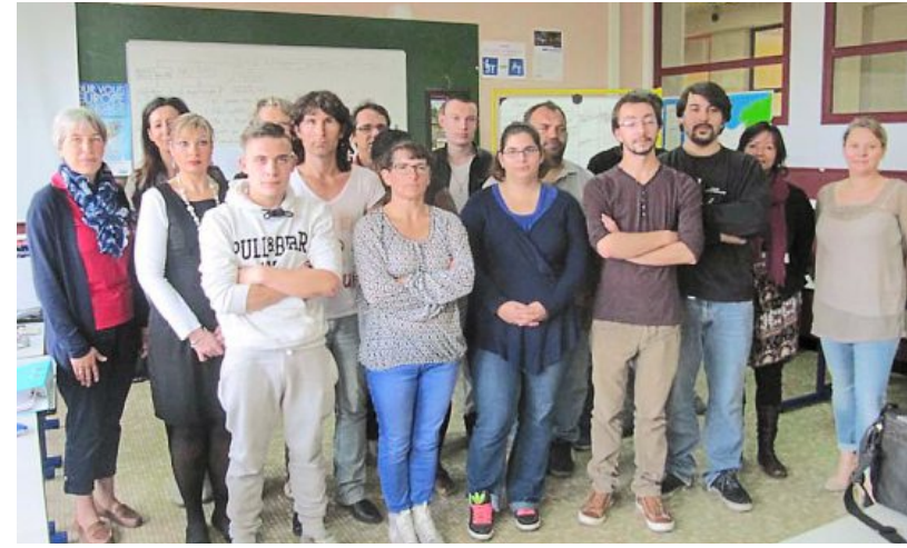
Les stagiaires en formation au Greta et les différents partenaires associés au projet Donnons de l'Elan's au vélo.

Une formation pour adultes, à l'initiative de l'Elan's, vise à favoriser l'intégration sociale et professionnelle.